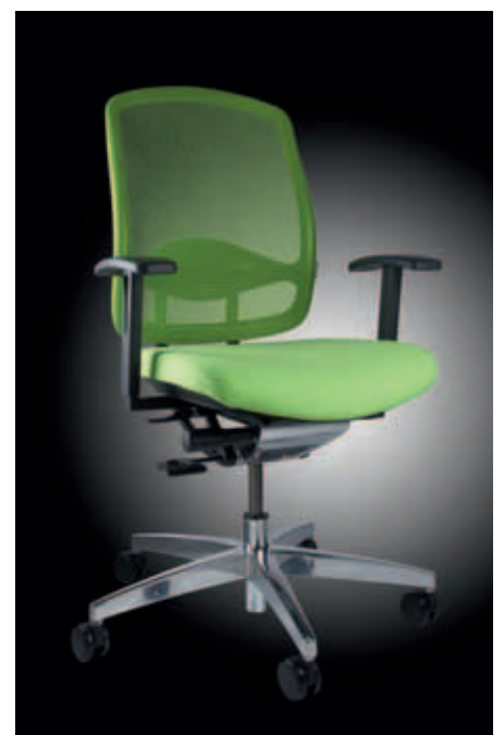
PRÄVENTION: Sitzen auf dem Alu Medic 5 soll Rückenschmerzen verhindern.