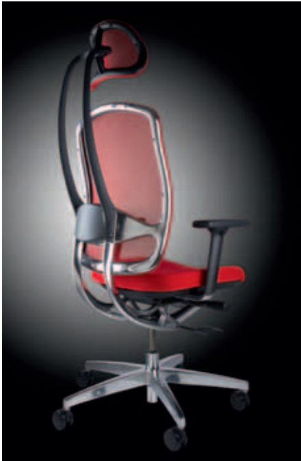
DONDOLA: der Wagner Alu Medic 10 mit Dondola-Technik.

unfallträchtig und erweist sich damit für die Nutzung als Bürostuhl als ungeeignet. Knie-sitze animieren zwar ebenfalls zu einem aufrechten und dynamischen Sitzen, können jedoch leicht kippen und belasten zudem die Knie übermäßig. Der herkömmliche Bürostuhl dagegen bringt heute in der Regel stützende Funktionen wie eine Synchronmechanik, Kopfstützen und verstellbare Armlehnen mit, die zwar jede Bewegung unterstützen, sie aber nicht fördern.